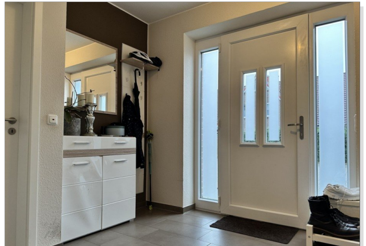
WE 1: Flur