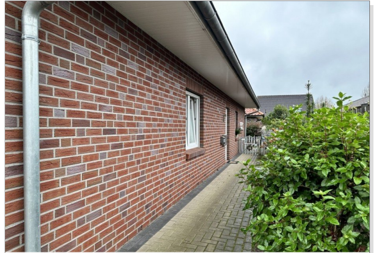
Eingang Whng. 1, 3 und 4