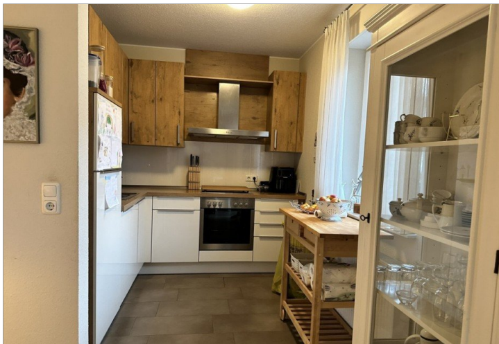
WE 1: Küche