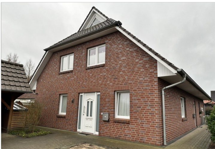
Eingang Whng. 2