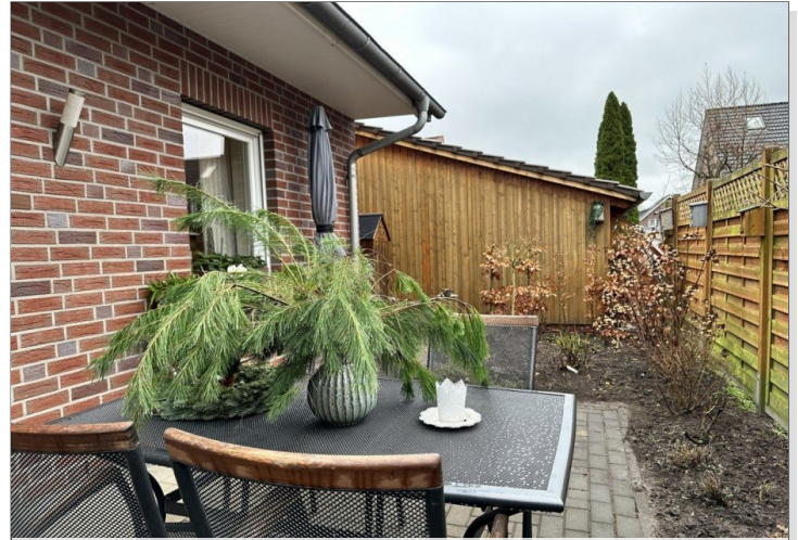
WE 1: Terrasse