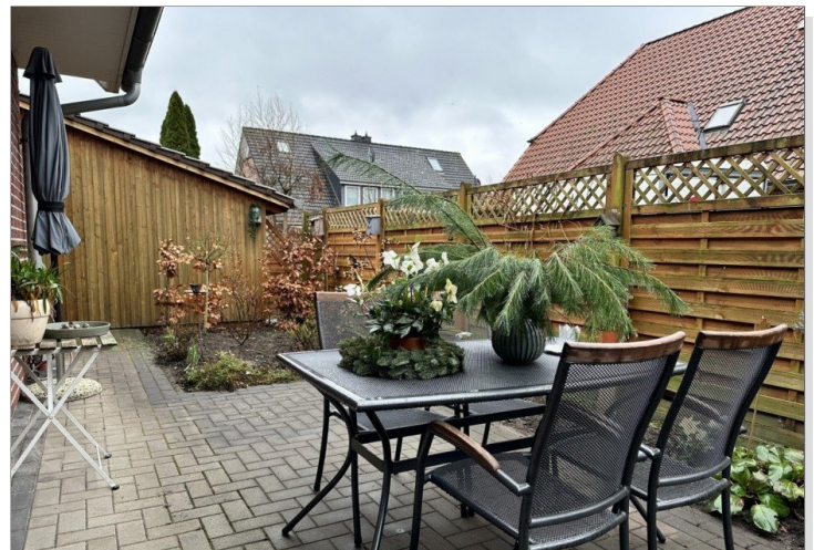
WE 1: Terrasse