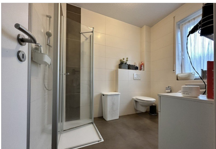
WE 1: Duschbad