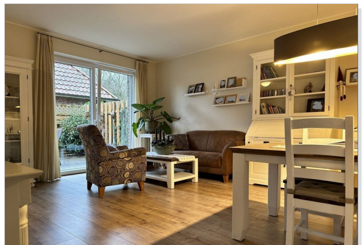
WE 1: Wohnzimmer