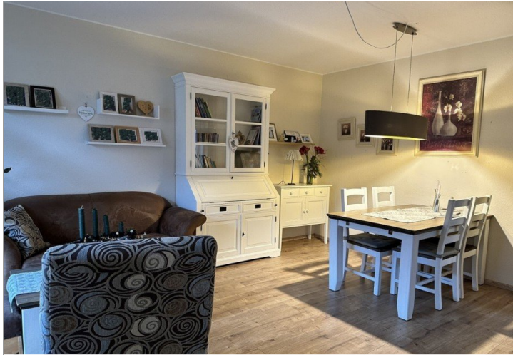
WE 1: Wohnzimmer