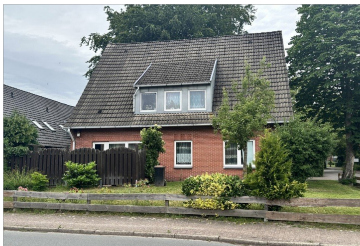
20825 vorn 3