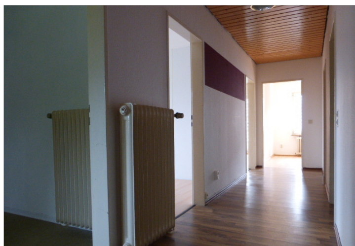
Flur im Dachgeschoss