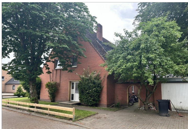
20825 Seite 2