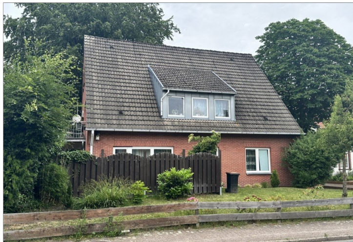
20825 vorn 2