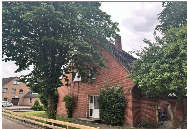
20825 Seite 3