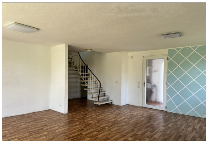
Haus 2: Treppe ins DG