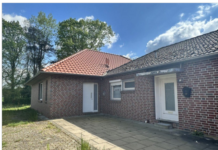
2 separate Eingänge