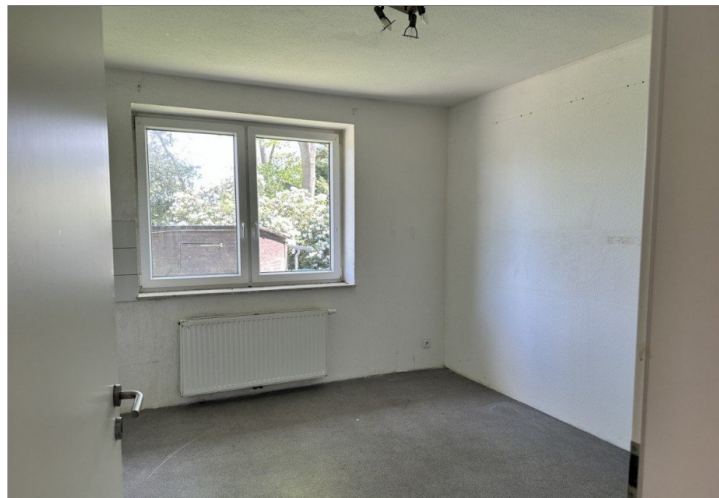
Haus 2: Kinderzimmer