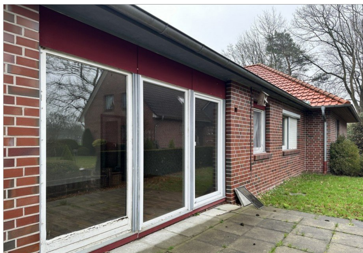
Terrasse des Altbaus