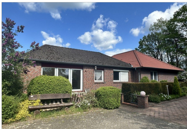
Blick vom Wendehammer