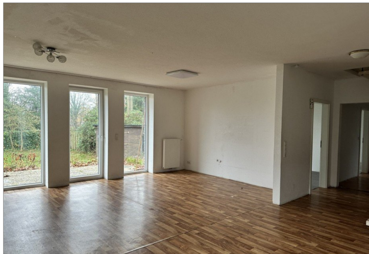
Haus 2: offenes Wohnen