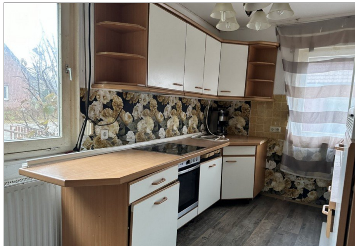
Haus 1: Küche