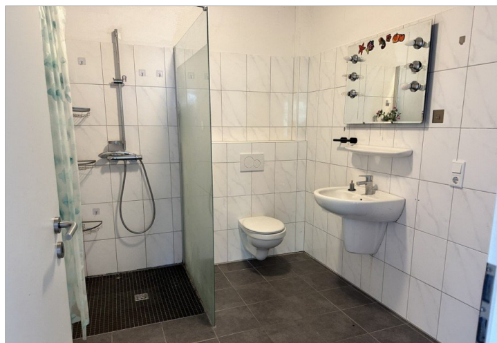
Haus 2: Duschbad