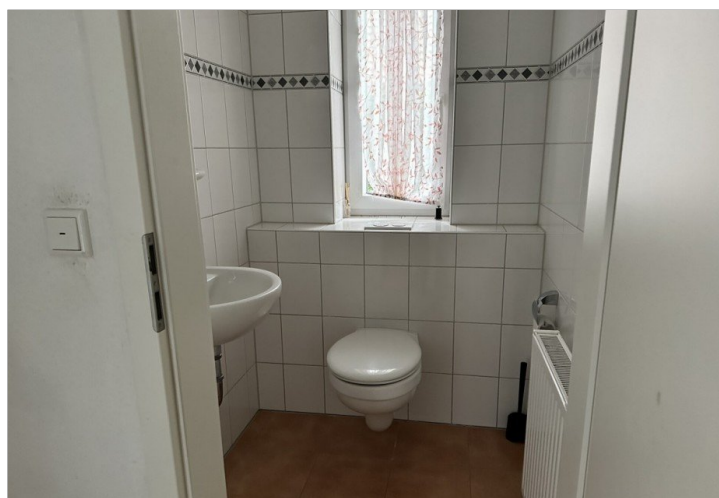
Haus 2: Gäste-WC