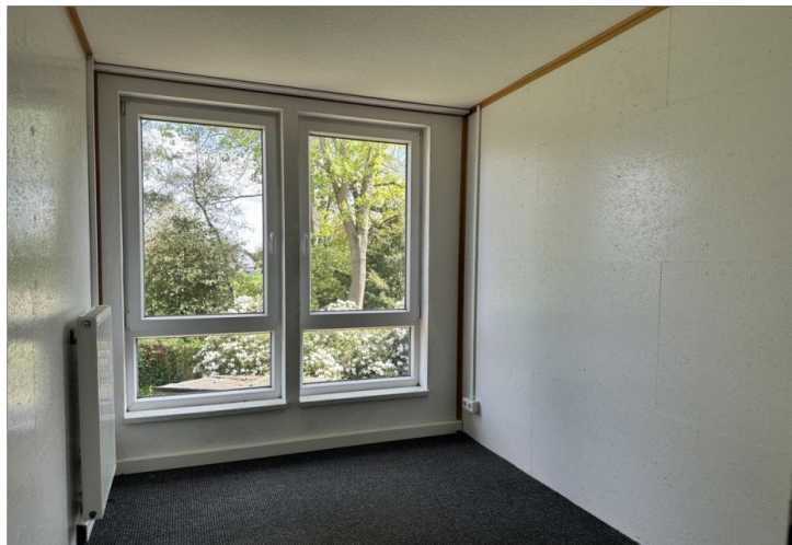
Haus 2: Zimmer im DG