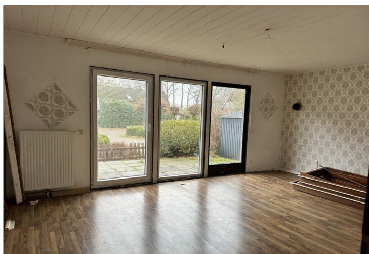
Haus 1: Wohnzimmer