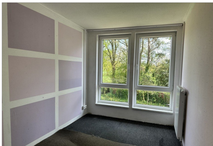
Haus 2: Zimmer im DG