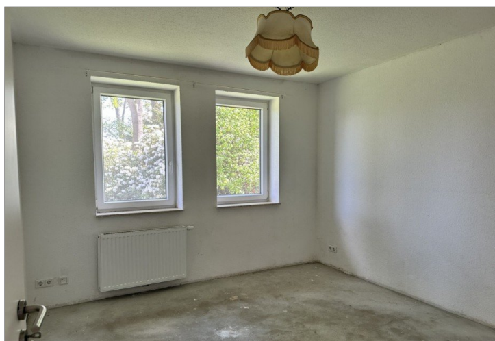
Haus 2: Schlafzimmer