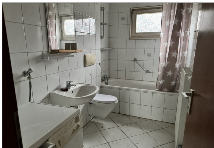
Haus 1: Bad