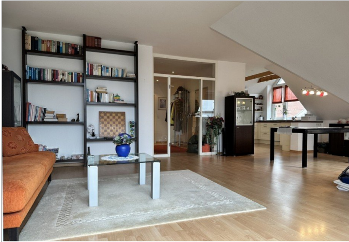
Großer offener Wohnbereich