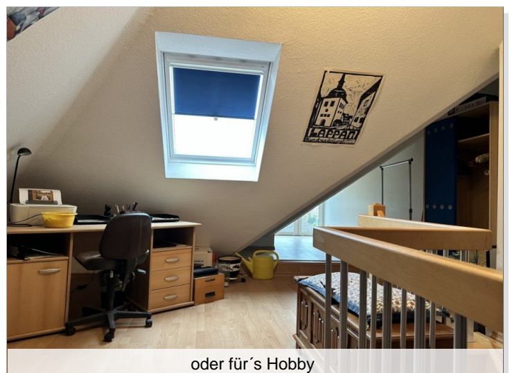
oder für's Hobby