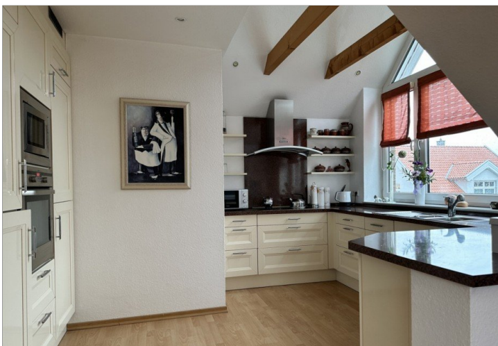
Mega: helle Küche