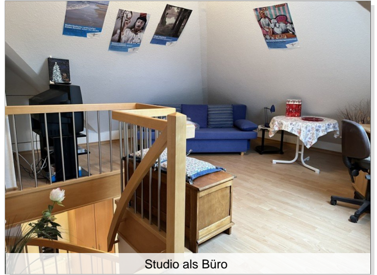
Studio als Büro