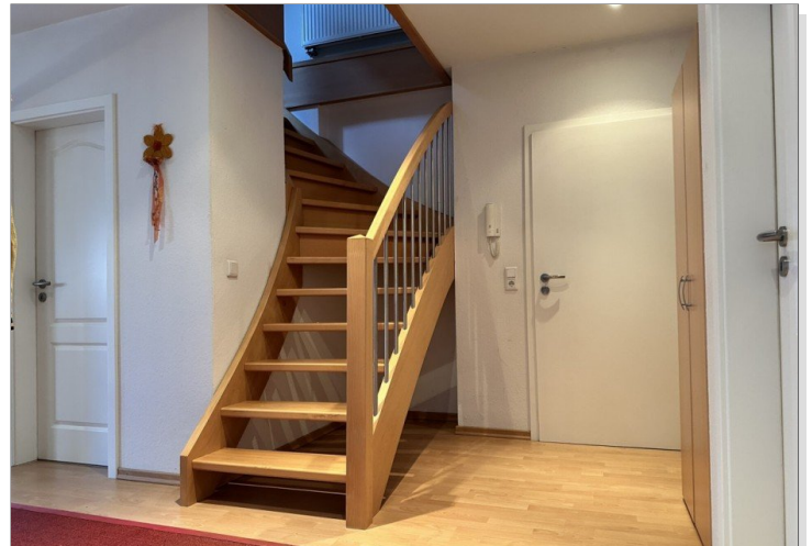
Aufgang zum Studio