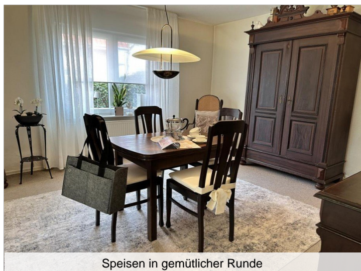
Speisen in gemütlicher Runde