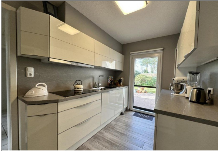
Küche mit Terrassenausgang