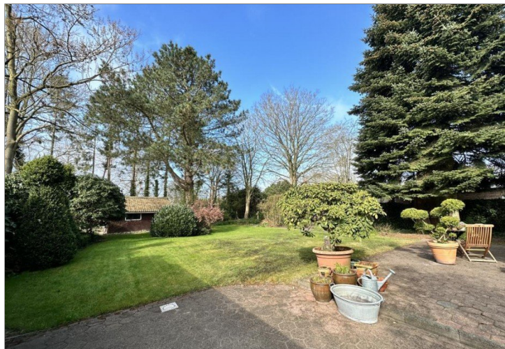
Baumbestand spendet Schatten