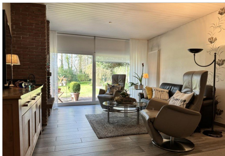
Hier eine andere Perspektive