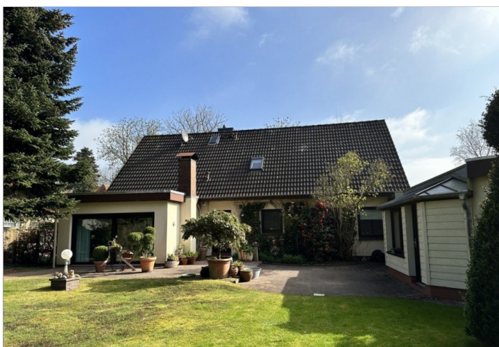
Ein schönes Arrangement