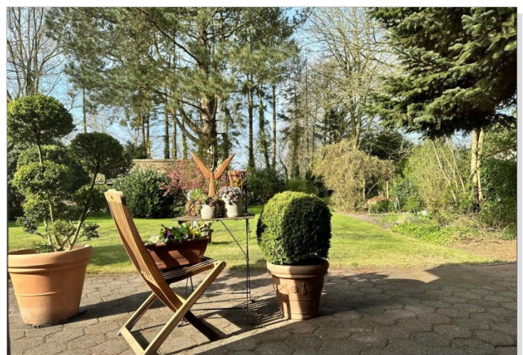
Mit Ausblick in die Natur