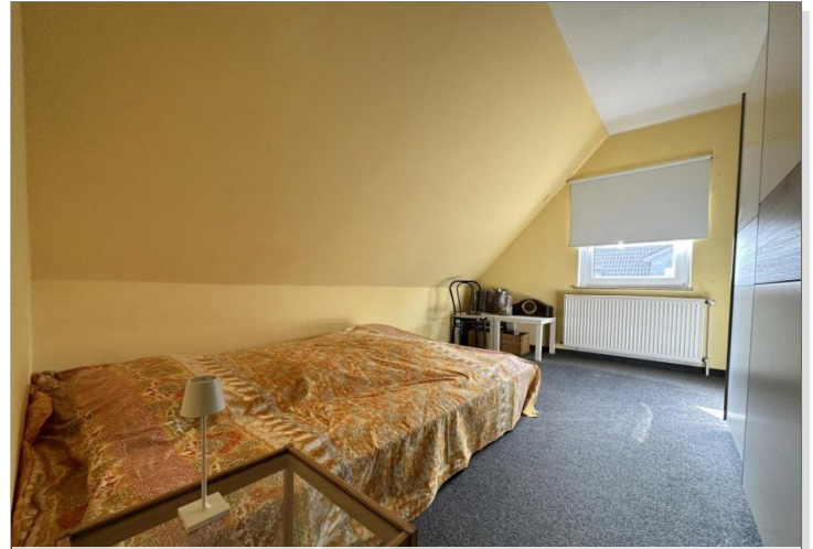
Kinderzimmer im DG