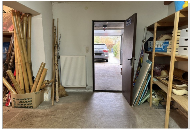
Durchgang zur Garage