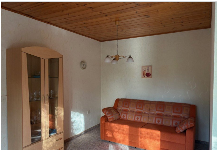
Wohnzimmer Wohnung I