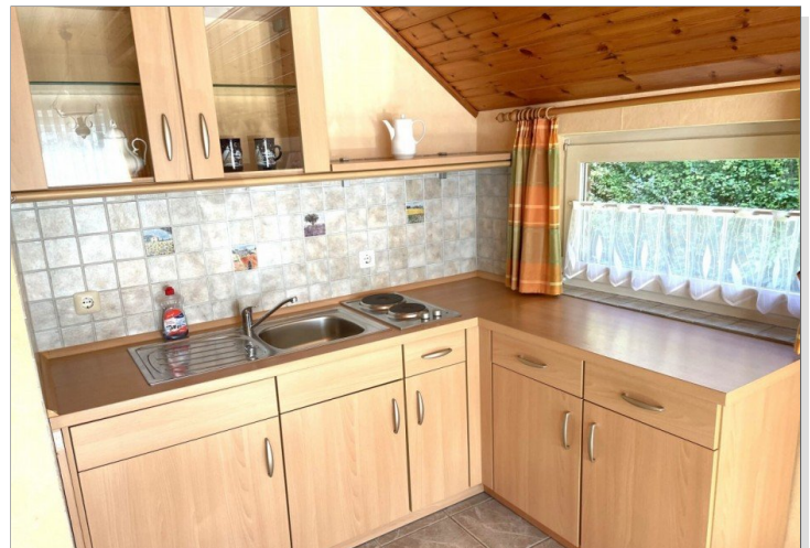
Küche Wohnung III