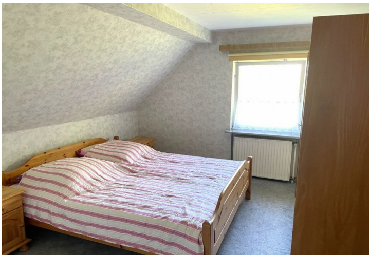
Schlafzimmer 1 Wohnung IV