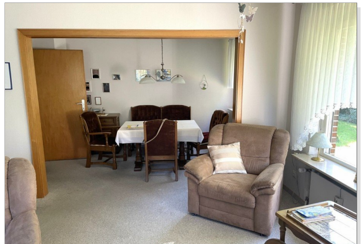
Wohnzimmer Wohnung II