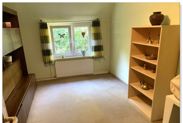
Schlafzimmer 1 Wohnung II