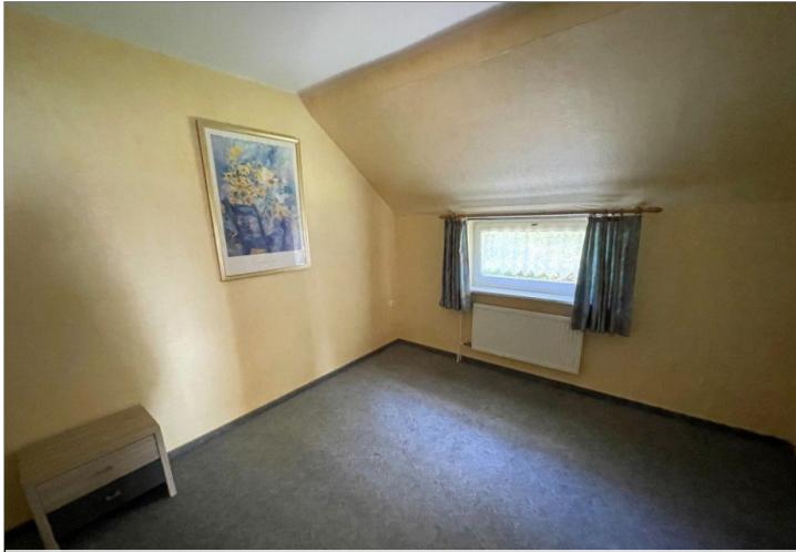
Schlafzimmer Wohnung III