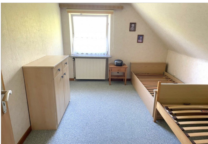
Schlafzimmer 2 Wohnung IV