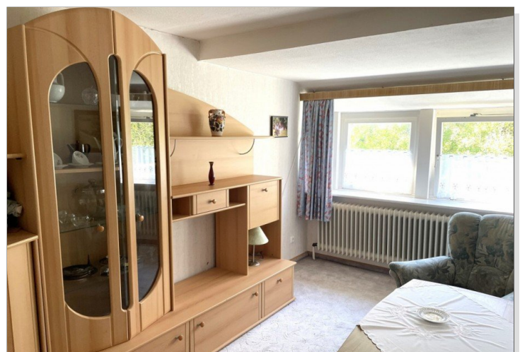
Wohnzimmer Wohnung IV