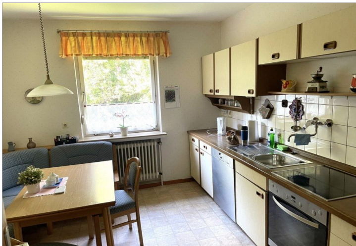
Küche Wohnung II