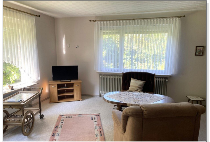
Wohnzimmer Wohnung II