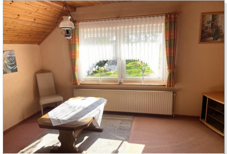
Wohnzimmer Wohnung III