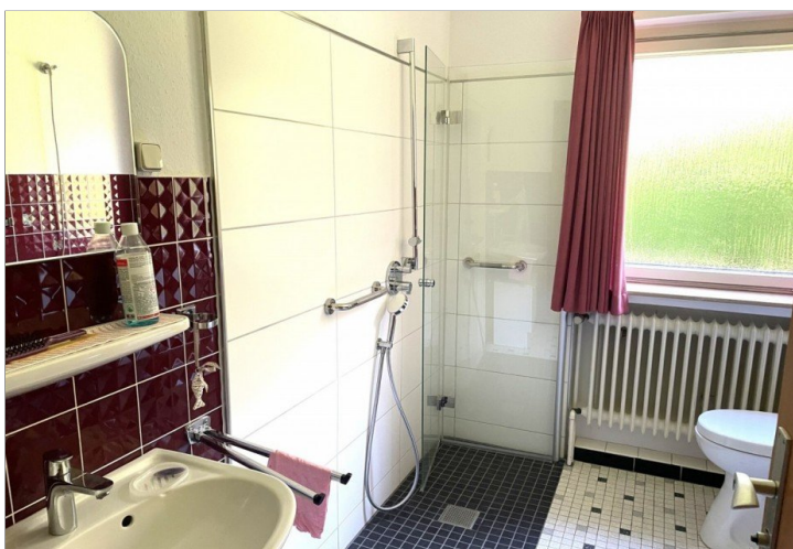
Badezimmer Wohnung II