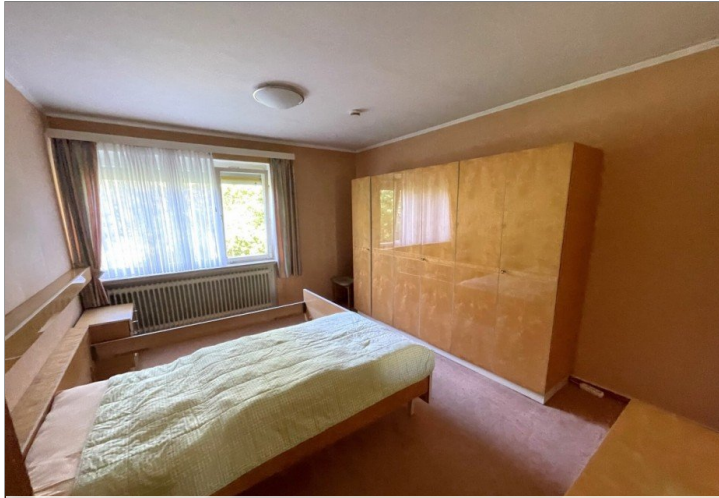
Schlafzimmer 2 Wohnung II