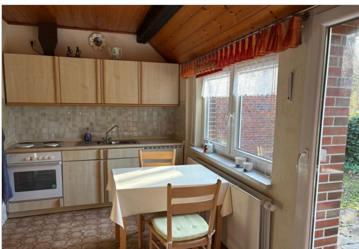
Küche Wohnung I