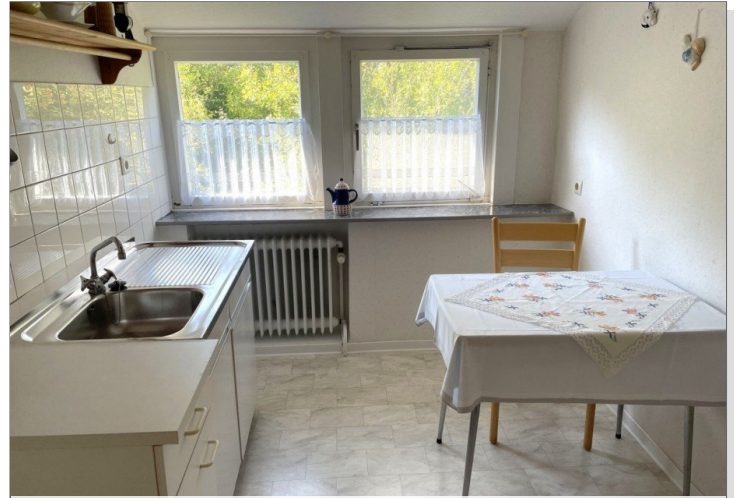
Küche Wohnung IV