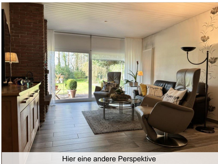
Hier eine andere Perspektive