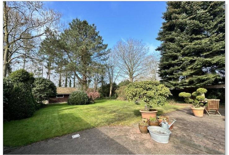
Baumbestand spendet Schatten