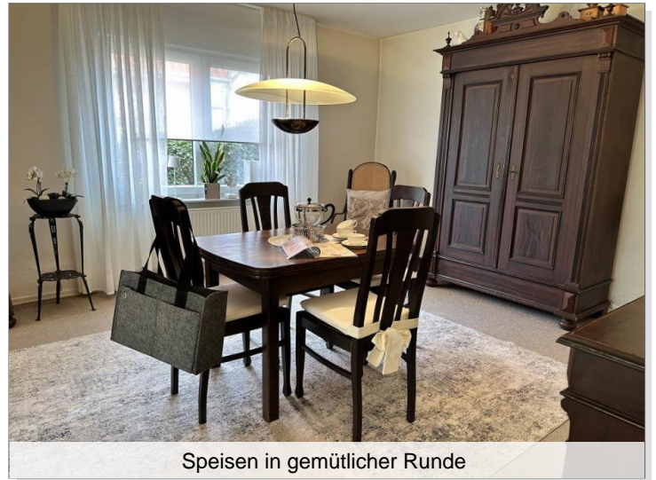
Speisen in gemütlicher Runde