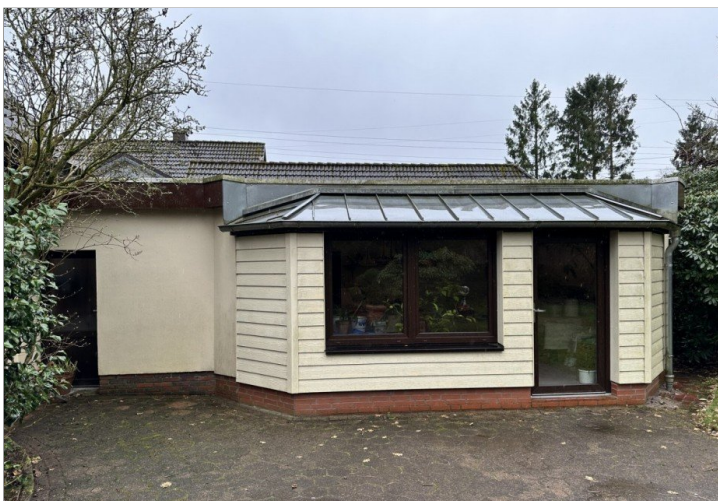
Auch gewerbl. nutzbar!