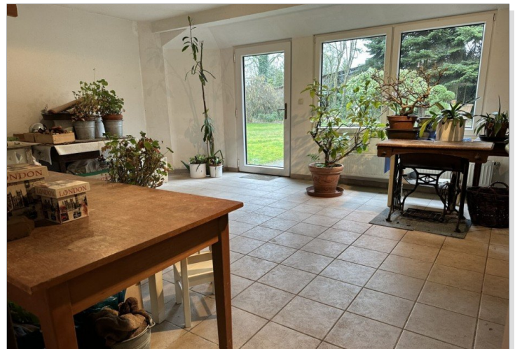
XXL-Büro oder Werkraum