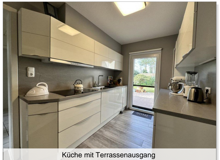
Küche mit Terrassenausgang