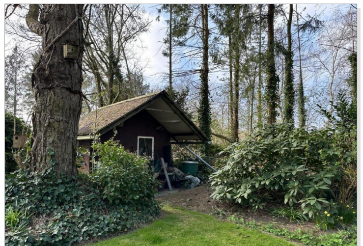
Gartenhaus mit Satteldach