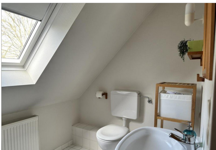
Bad im DG: Baujahr 1988