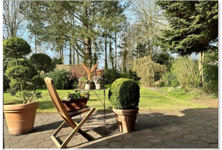
Mit Ausblick in die Natur