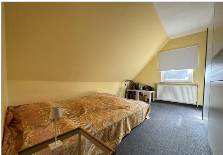
Kinderzimmer im DG