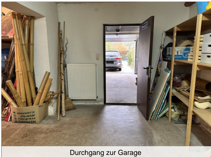
Durchgang zur Garage