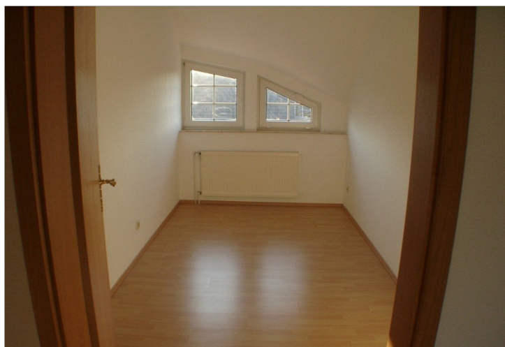
Ihr neues Arbeitszimmer ??