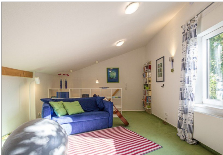
ausgebautes Obergeschoss (Hobbybereich)