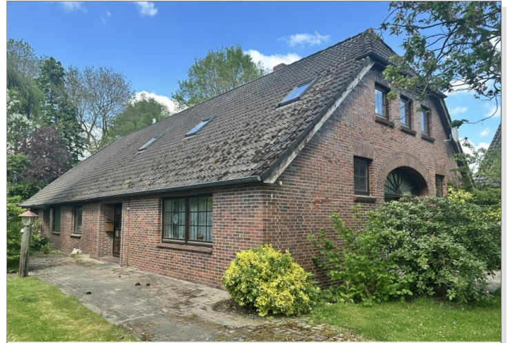
Eingang WE1 & Fewo