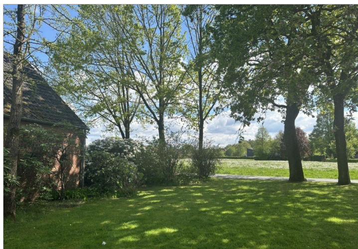
Auch hier grüne Wiese